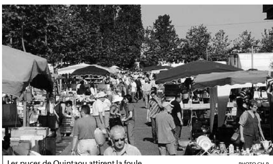
Les puces de Quintaou attirent la foule

■ Créées en septembre 2001, les Puces de Quintaou sont aujourd'hui le rendez-vous mensuel incontournable des brocanteurs et des chineurs de la Côte Basque. Elles fêteront, samedi, leur 5ème anniversaire. Ce marché qui rassemble, chaque 4ème samedi du mois, 120 exposants sur l'esplanade de Quintaou, s'est rapidement imposé comme l'une des références régionales dans le domaine de la brocante et des puces. Plusieurs milliers de visiteurs et de curieux y déambulent en quête de la bonne affaire et de l'objet rare. Ce succès est non seulement, dû à un engouement certain et branché pour la brocante mais également le fruit d'une impor-