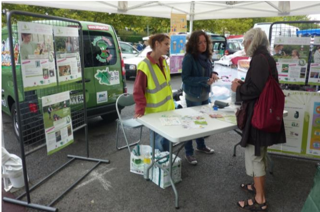
Les ambassadeurs du tri en action sur le marché aux Puces

« Le syndicat Bil Ta Garbi a pour mission de traiter et de valoriser les déchets ménagers de la partie ouest du département incluant les déchets des habitants de l'Agglomération Côte basque-Adour. Dans cette optique, le Syndicat a placé la réduction et la réutilisation des déchets au cœur de sa politique et c'est la raison pour laquelle il a signé en décembre 2009 avec l'ADEME un Programme local de prévention des déchets dont l'objectif principal est de réduire de 7% la production individuelle d'ordures ménagères d'ici 2014.